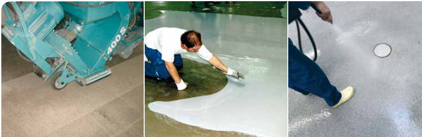
Bodenoberflächen strahlen ... .. ausgleichen & beschichten ... .. schnell & sauber!